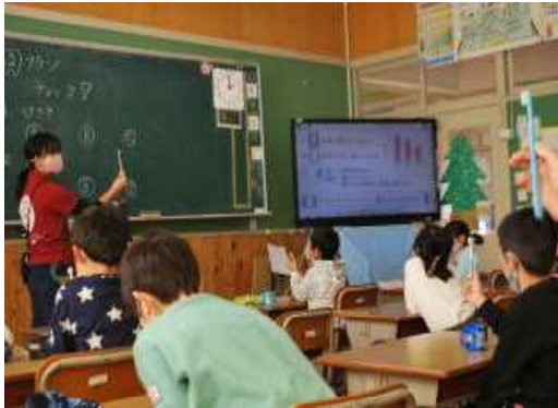
(1年生の歯ブラシチェックタイム)

内牧小学校では、定期的に歯ブラシチェックを行い、歯ブラシの毛先が開いていたり、汚れが目立つ歯ブラシは新しい歯ブラシに交換しています。低学年では、歯ブラシの毛先をかむ子がいて、取り替えてもすぐ毛先が開いてしまう子もいます。毎日、ちゃんとみがいていたら、