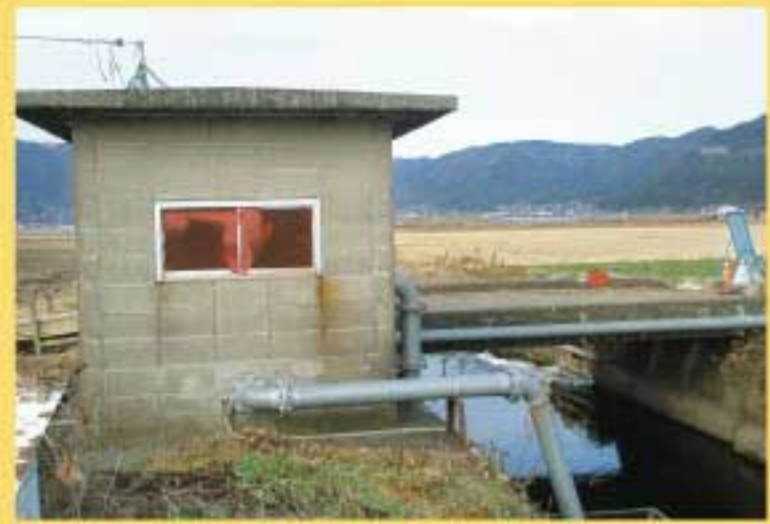
・4工区3号ポンプ場