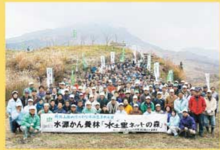
・水源かん養林植樹