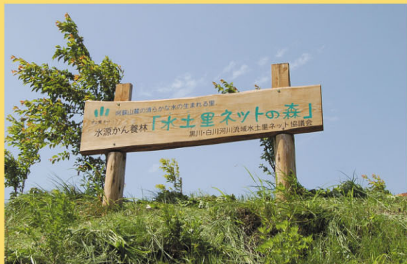
水土里ネットの森看板