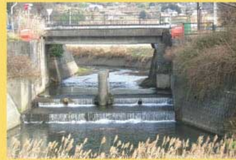
・古城ヶ鼻の転倒堰

農業用水・水源林の守人 水土里ネットの宮(一の宮町土地改良区) 流域連携プロモーター