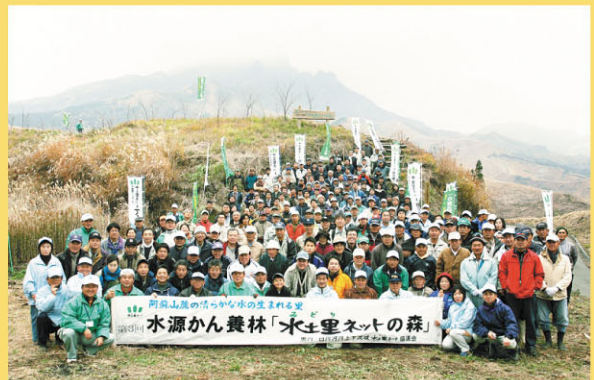
平成19年度 第3回植樹集合写真