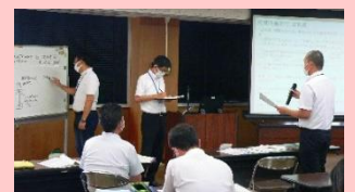
玉名管内での研修の一場面

○今回学んだことを基に、町内の小中学校で方向性を揃えて、小中学校のつながりがある教育活動を進めていきたいと思っています。