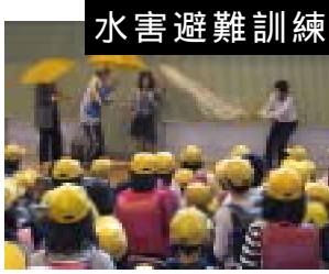
5/27(水)体育館にて水害避難訓練実施。芸達者な先生方のショート劇付きの指導。