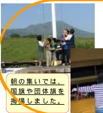
朝の集いでは、国旗や団体旗を掲揚しました。