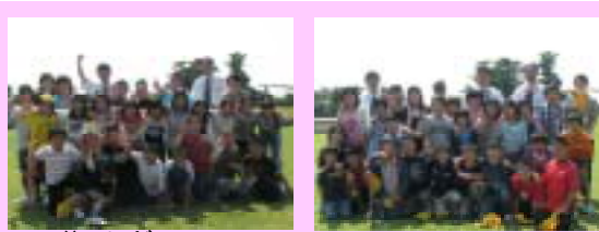
水俣環境センターの見学

いなま日貝をだの達今こ先 出くし焼天二をだの泳海し樂もに生一古小先んるう入グご怖 が、たき気日拾り泳海したしてつ潜方体閑出でこかをとい井澤 でと。して間、砂たり、のののがが最でいてたのか、のの できまも気学たもとしまり、活動で二高潮、の人のどの した。しけにまともたたり、ふかた。二日目 いが帰しもた。か、のの 思もりくよ。ん