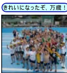
きれいになったぞ、万歳！

今年度もプール掃除を行いました。今年度もプール掃除を行いました。今年度もプール掃除を行いました。