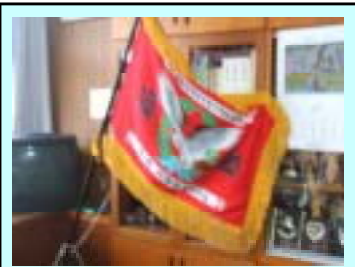
女子の部は、小雨模様の中で、高森中央小と尾ヶ石東部小と対戦し、大勝しました。

女子ソフトボール部が優勝しました。女子ソフトボール部が優勝しました。女子ソフトボール部が優勝しました。