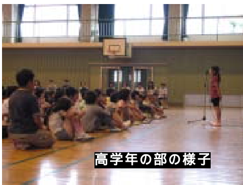
高学年の部の様子

六月三十日(火)、校内童話発表会を行いました。六月三十日(火)、校内童話発表会を行いました。六月三十日(火)、校内童話発表会を行いました。