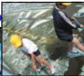
すごい汚れだな。でも、きれいにすると、頑張るぞ！