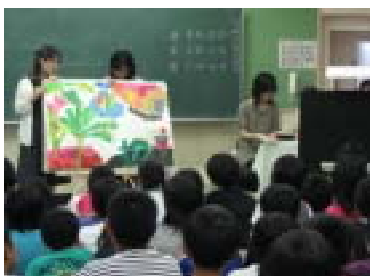
6月22日沢山の方においていただき、低中高に分かれて開催しました。