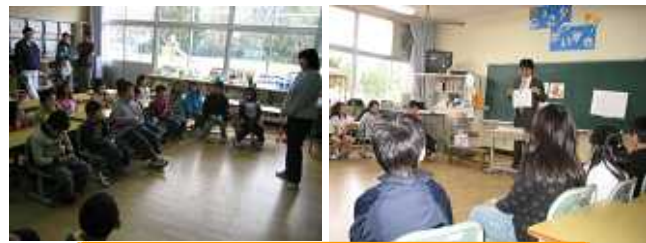
2の1(右写真) 2の2(左)。4枚の動物の写真は「犬、鶏、蛙、兔」でしたが、始めは鶏や蛙にも「おへそ」があると考えていた子どもたちでした。正解もわかり、最後にはひみつを解き明かしました。

二年一組 生活科 二年一組の授業参観の様子です。先生が動物の写真を示しながら、動物の習性や特徴について説明しています。