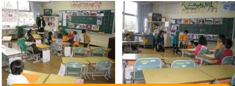
1の1(右写真) 1の2(左)。1年間の思い出をはきはきと発表する時間です。行事の写真をもとに思い出作文を書きました。

一年一組 国語科 一年一組の授業参観の様子です。先生が黒板に書いた問題を指さしながら説明しています。生徒たちは真剣に聞いています。