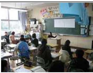
卒業を前に生きるということについてみんなで考えました。

六年一組 学級活動 六年一組の学級活動の様子です。先生が話をし、生徒たちは真剣に聞いています。