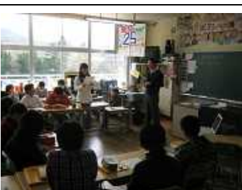
頑張ったことや自分のよさを再確認している場面です。

六年二組 国語科 六年二組の国語科の授業参観の様子です。先生が黒板に書いた文章を読み、生徒たちは感想を述べています。