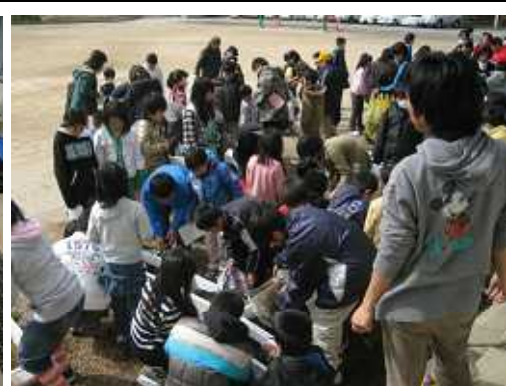
春を迎える 全校花いっぱい運動

編集後記(お礼) 一年間のご愛読ありがとうございました。特に、各部落に回覧いただきました。区長様、組長様には心より感謝申し上げます。別件ですが、学校のホームページの情報が古いとの指摘がありました。昨年度分の碧水だよりは四月に更新してまいりました。が、申し訳なく思います。三月中旬、この碧水だよりを一年分掲載します。また、「新着情報」欄に学校の行事の子どもたちの様子を簡単に紹介し始めました。写真は子どもが顔が特定できないサイズにいたしましたので、見にくくご高覧頂くと幸いです。