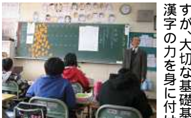
4の1(右写真)は、インフルエンザにより、3月13日に授業参観。4の2(左写真) 両クラスとも、感謝の作文に思わず涙ぐみ、顔を上げられない保護者が続出し、担任も涙腺がゆるみっ放しでした。

四年一組 総合の時間 四年一組の総合の時間の様子です。先生が授業を進め、生徒たちは積極的に参加しています。