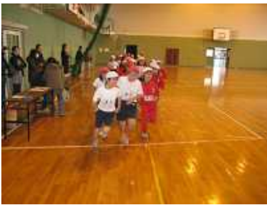
元気に体育館を走る様子。元気いっぱい3年生は体育大好き。

二年一組 生活科 二年一組の授業参観の様子です。先生が動物の写真を示しながら、動物の習性や特徴について説明しています。