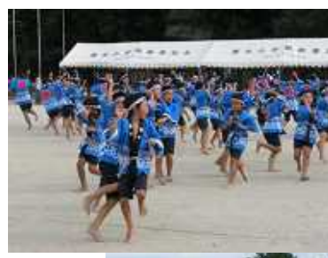
飛び入りの佐藤市長