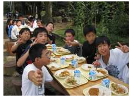
校庭の碧空教室で給食を食べる六年生