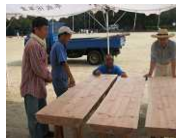
よかつのできたばい。