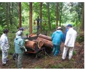
切り株の運び出し