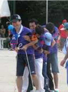
部落対抗百足競争