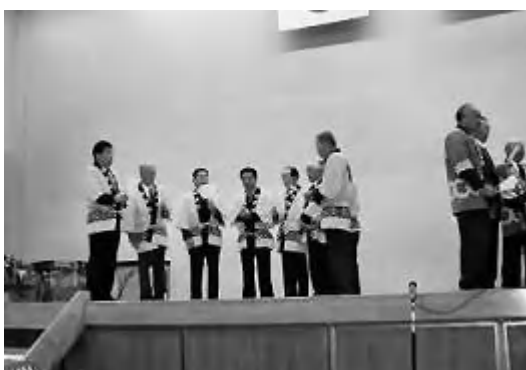
南黒川と蔵原区の保存会の長唄