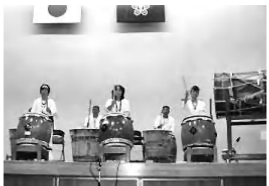
阿蘇ふれあい太鼓の演奏