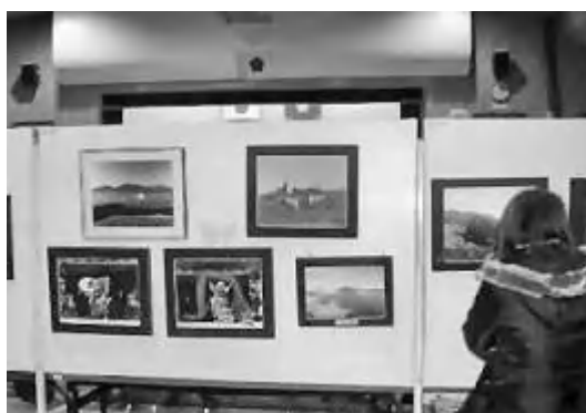
展示の部での様子

児童たちの聞く態度が少し良くなかったことと、座るイスが少なかったこと、発表が少し聞きにくかったこと、などは反省材料として今後にかかしていきたいと思います。