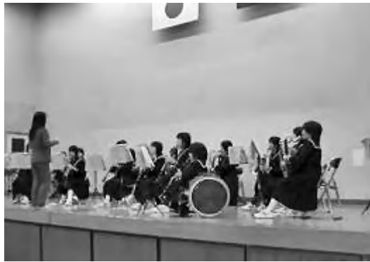
中学校の吹奏楽部演奏

碧水フェスティバルは、地域と連携した取組みの一つとして、従来学習発表会として学校と保護者に限定して行っていたものを、地域に呼びかけステーションや展示の部に参加していただくよう校区の区長さん方や各種