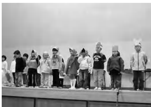
二年生の大きなカブ

やお父さん方のきれいなハーモニイが聞かれ、練習の成果が見事に現れた発表となりました。特にプログラム最後の六年生は、修学旅行で学んだ戦争と平和についての発表と「カノン」の合奏は最上級生らしく立派に行われ碧水フェスティバルを締めくくりました。