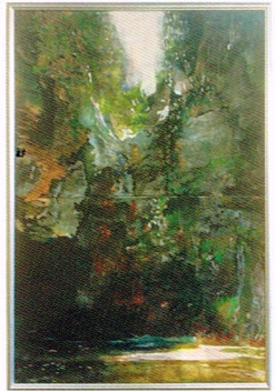
【南阿蘇秘境 清水滝】