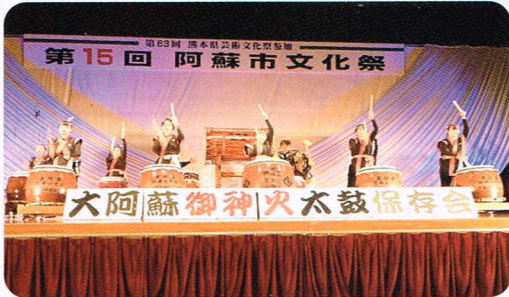
(文責 副委員長 林 和子)

観覧いただいた方から「日頃の皆様の成果を見られて良かった」「文化祭を見学させていただき、元気をもらった」等色んな声を頂き『出来て良かった文化祭』でした。早くコロナが終息し、皆様が楽しく発表出来ることを祈念致します。