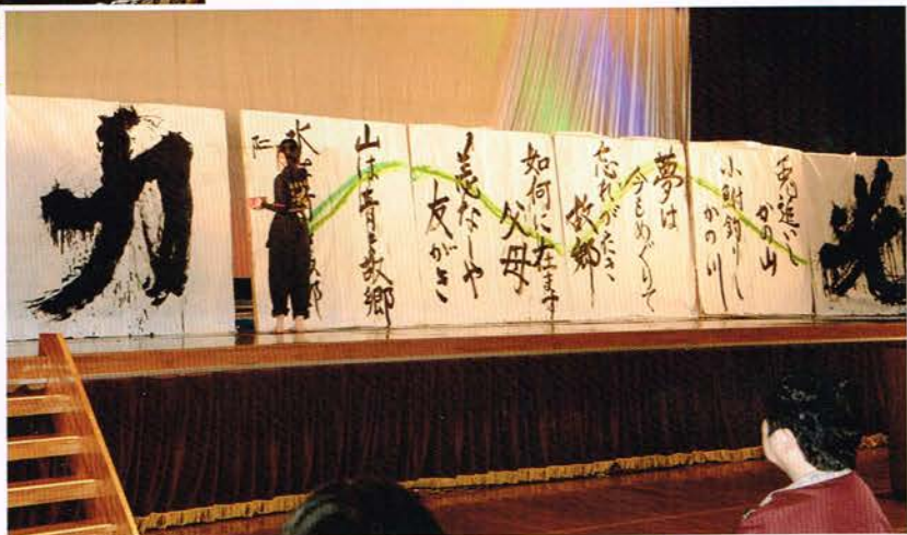
阿蘇中央高校 書道部