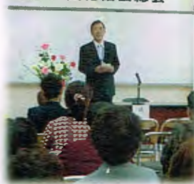
阿蘇市文化協会総会

(新組織は四面に掲載) 次年度は協会創立十年になります。更なる阿蘇市文化協会の発展と会員会の活躍を誓って総会を終わりました。出席者は六十八名でした。