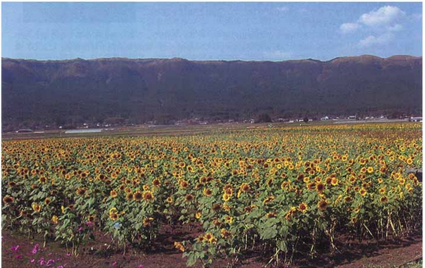
農地・水・環境保全向上対策事業モデル地区 13工区

発行者/阿蘇土地改良区 阿蘇市黒川1451番地2 TEL 0967-34-0749 TEL 0967-34-1230 FAX 0967-23-4150