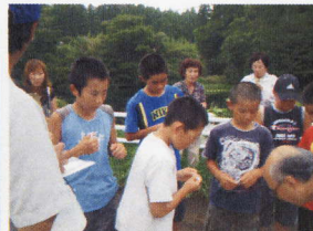
←簡易測定器 で水質の調査