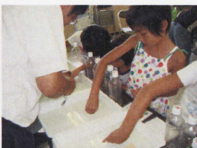
←バックテスト による調査。