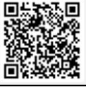
↑学校ブログQR 随時更新中